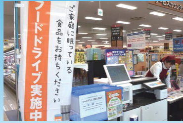
ダイエー2店舗では、5月21日(月)~27日(日)にフードドライブを行う予定です。

食品を扱う企業では、賞味期限と消費期限の管理のため、一定のルールに基づいて期限前に店頭から食品を撤去し、廃棄していましたが、フードバンクと連携し、食品廃棄物の抑制と食品の有効活用を図る動きが広がっています。フードバンクちばでは、昨年より(株)カスミと今年5月より株式会社ダイエーと連携が始まります。(株)カスミでは、フードスクエア千葉みなと店とフードスクエア稲毛海岸店の2店舗で、店舗での販売期限が過ぎた食品を2週間に1度、株式会社ダイエーでは、グルメシティ千葉中央店とダイエーモリシア津田沼店・イオンフードスタイルの2店舗で、毎月第3週に行うフードドライブで集まった食品と店舗から出る処分食品を合わせて月に1回ご寄贈いただく予定です。双方とも非常に熱心に取り組んでくださっていて、食品を扱うからこそ、無駄にたくないという思いが伝わってきます。