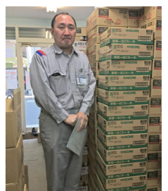
東京ガス株式会社佐倉支社様にお届けいただいた様子。

定期的に株式会社永谷園様・ヤマサ醤油（株）様・コカ・コーラボトラーズジャパン様よりたくさんの食品・調味料・飲料等を寄贈いただいています。公益財団法人鉄道弘済会戸田駅前保育所様よりアルファ米（50食：1箱）・乾パン（24缶：3箱）・災害用クラッカー（24缶：3箱）、三和商事様より災害用保存パン（24缶：75箱）、印西市役所様よりアルファ米（50食：54箱）・防災食ラーメン（50食：7箱）・災害用リッツ（10缶：4箱）・災害用クラッカー（24缶：4箱）・保存水500ml（24本：22箱）・粉ミルク（8缶：24箱）、株式会社ブリッジアンドサン様よりカレースライス、マブチモーター株式会社様よりアルファ米（50食：69箱）・災害用保存パン（24缶：19箱）・防災食（さば味噌煮（50食：9箱）・牛丼の具（50食：9箱）・ポークカレー（50食：7箱）・災害用ようかん（60個：30箱）・ピリ辛肉缶詰（24缶：19箱）・保存水500ml（24本：2箱）、東京ガス株式会社佐倉支社様より野菜ジュース（30缶：15箱）、株式会社吉田製作所様より災害用保存パン（24缶：36箱）、JA全農ミートフーズ株式会社様より災害用クラッカー（24缶：6箱）、ソニーグローバルマニュファクチャリング&オペレーションズ株式会社木更津サイト様よりアルファ米（50食：12箱）・防災食（さば味噌煮（50食：8箱）・牛丼の具（50食：8箱）・ハンバーグ（50食：8箱）・筑前煮（50食：8箱）・肉じゃが（50食：8箱）・きんぴらごぼう（50食：8箱）、全国農業協同組合連合会千葉県本部様よりコンクール出品米（5kg×60袋）、浅草今半様より贈答用佃煮、株式会社金田臨海総合様より缶詰・調味料他、千葉商業高校様より災害用保存パン（26缶）・リポビタンD（15本）・保存水500ml（20本）、有限会社ダスカジャパン クアウテモック様よりチョコレート（60kg）、マルコメ株式会社様よりインスタントみそ汁（800個）、テサテブ株式会社様よりフードバー（470個）・ウォーターパック（470個）、パチンコVEGA千葉南店様/企業組合アドベンチャーバケーションネットワーク様よりお菓子をいただきました。ご支援ありがとうございました。