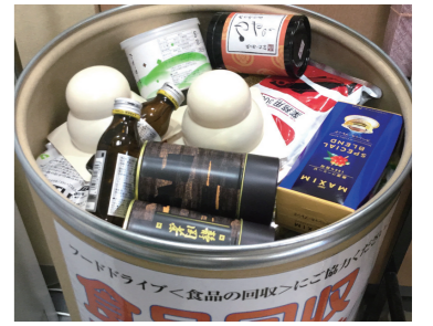
コープみらい東寺山店の食品回収ボックスに集まったさまざまな食品。

1～2月に行いました第18回フードドライブでもたくさんの食品が集まりました。今回のフードドライブの合計回収量は、約10.3トン、お米が多く集まる9～10月の時期を除くと最高値となりました。フードドライブの度に寄贈して下さる方等、リピーターが増えているという点も大きな要因だと思っています。また、フードバンクちばには、毎日、宅配便でご家庭や病院、お寺等さまざまなおところから食品が届きます。直接持ってきて下さる方もいます。そうした善意の積み重ねが10トンもの量になるのかと思うと、あらためてものすごいことなんだと実感します。食品を寄贈して下さった皆さまはもちろん、普段の業務もある中、毎回、食品を預かって下さる受け取り窓口の皆さま、本当にありがとうございます。フードバンクちばがスタートして6年が経ちますが、この間、生活困窮者自立支援法が施行され、食の支援の重要性も高まっており、さまざまな機関や団体との連携が広がりました。また、毎日県内の各機関から届く食料支援の要請に基づき、食品を箱詰めしていく作業では、地域のボランティアの皆さまのご協力が不可欠です。寄付や会費収入、助成金等の財政面から支援もなくてはならないものです。単なる民間のボランティア活動にも関わらず、フードバンクちばがここまで続けてこれたのは、多くの方々の支えがあってこそです。地域の中で無駄をなくし、地域の中で困っている方々の一助になるよう今後も努力していく所存です。引き続き、ご協力どうぞよろしくお願いいたします。