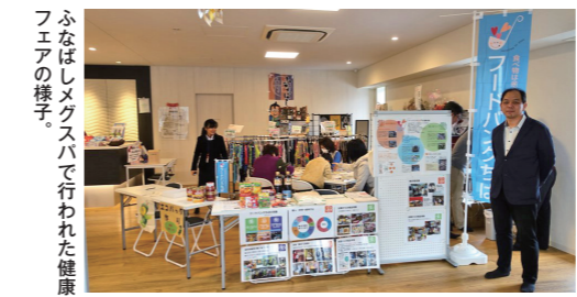
ふなばしメグスパで行われた健康フェアの様子。