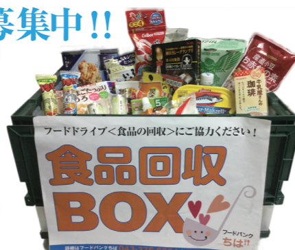
個人支援に利用させていただいている食品の一例