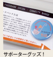
サポーターグッズ!